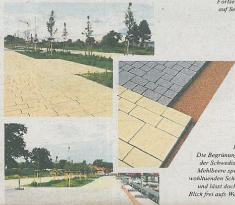
Fortsetzung auf Seite 2!